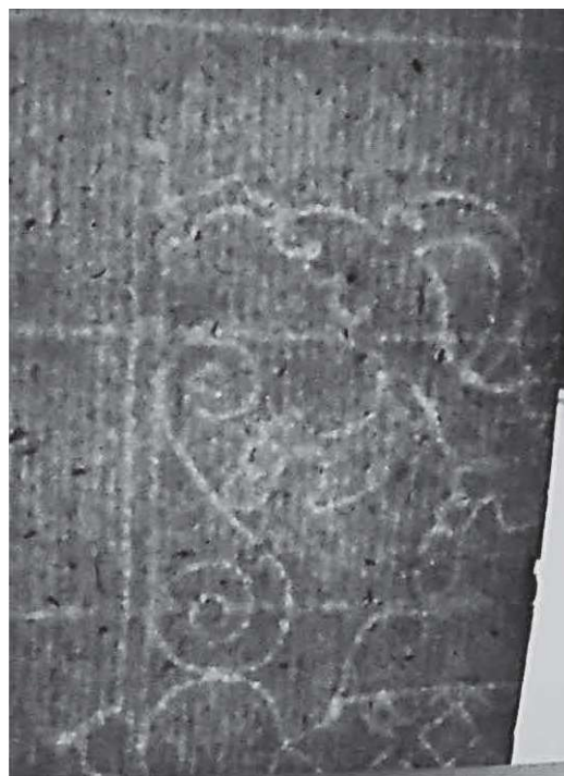
Figuur 3 Boven een stuk van de leeuw, rechtsonder twee van de drie kruisjes van het wapen van Amsterdam