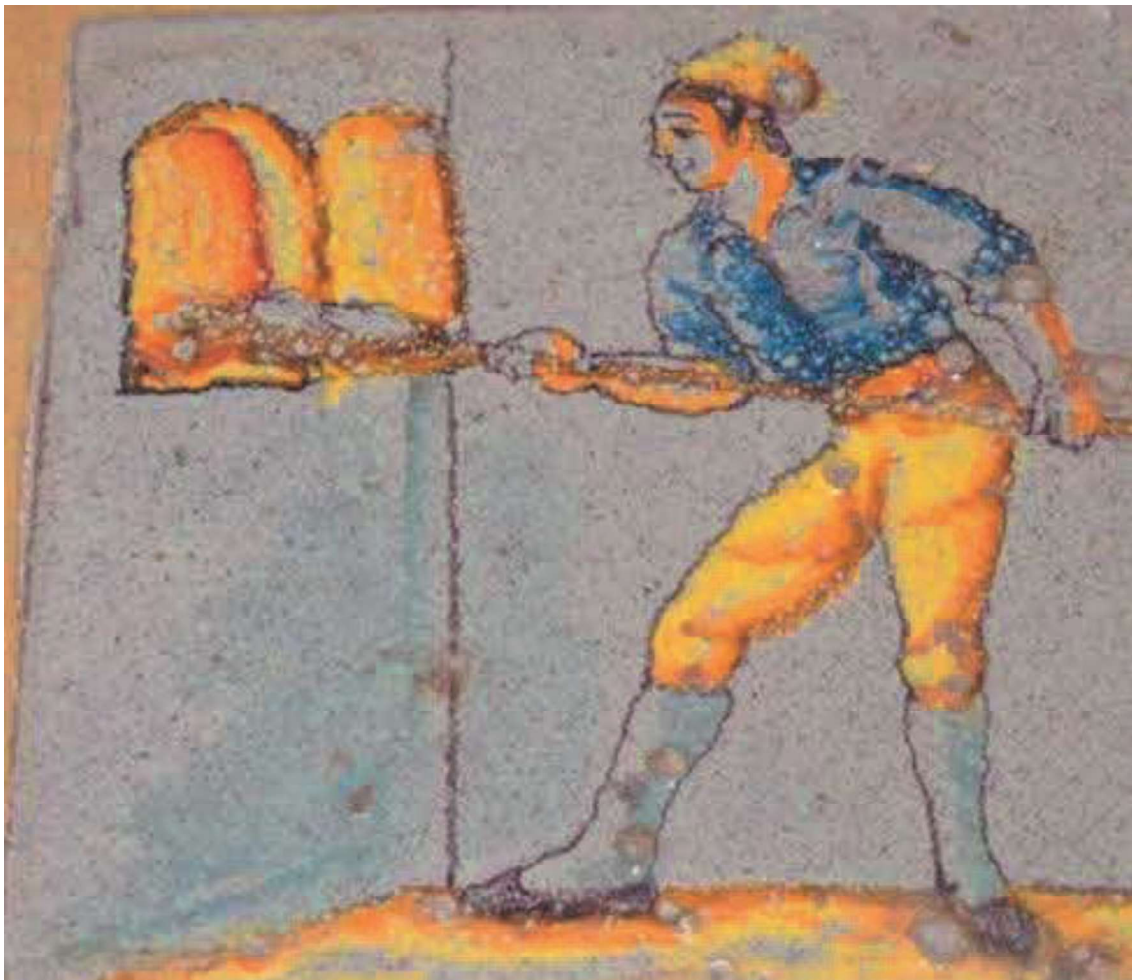
Figuur 5 Tegel Bakker bij een oven, tegel 19 e eeuw. https://www.spijkertegels.nl/mensen-beroepen/bakker